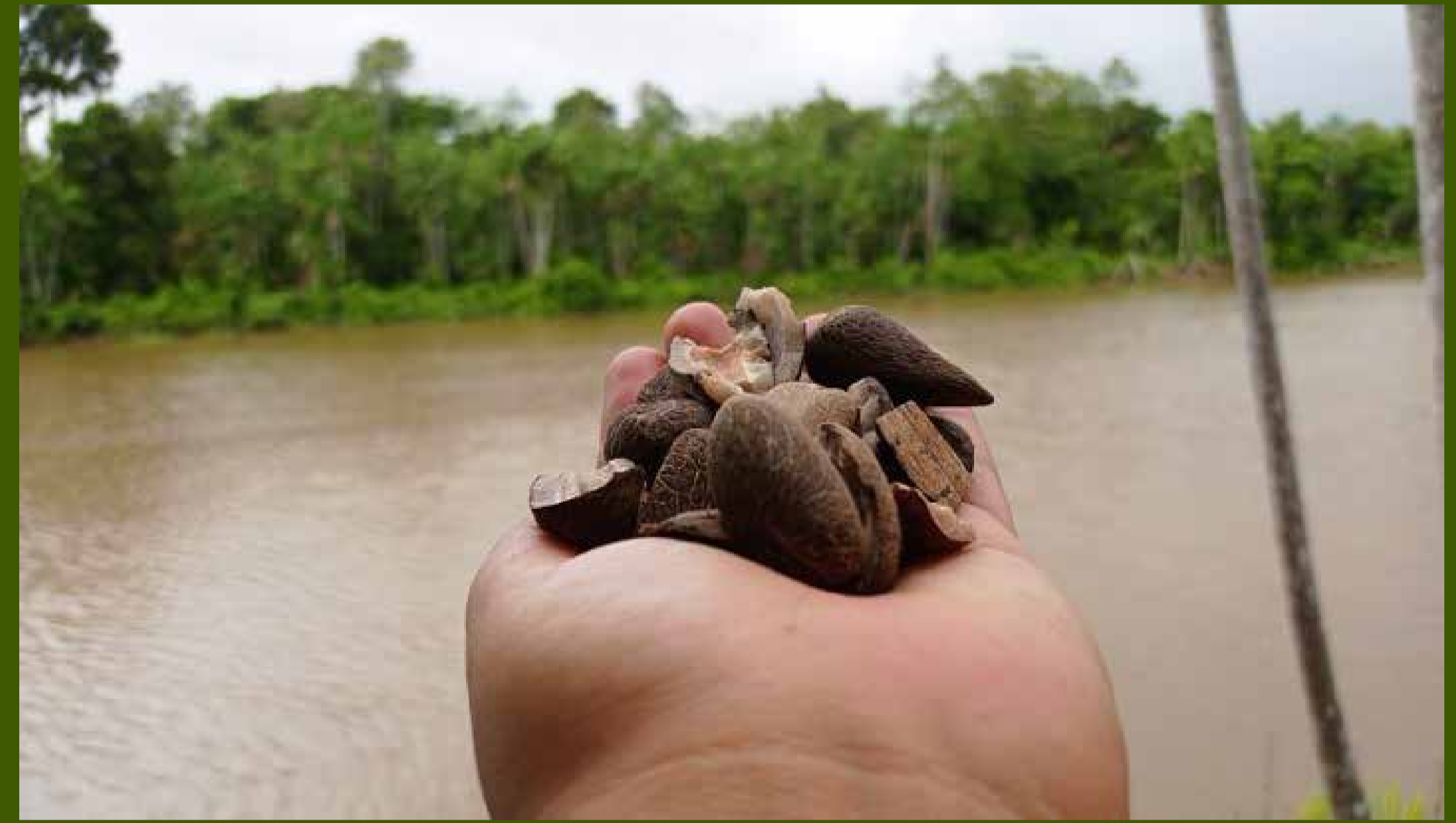
Castanha do Murumuru. Associação ATAIC, parceira NESST.