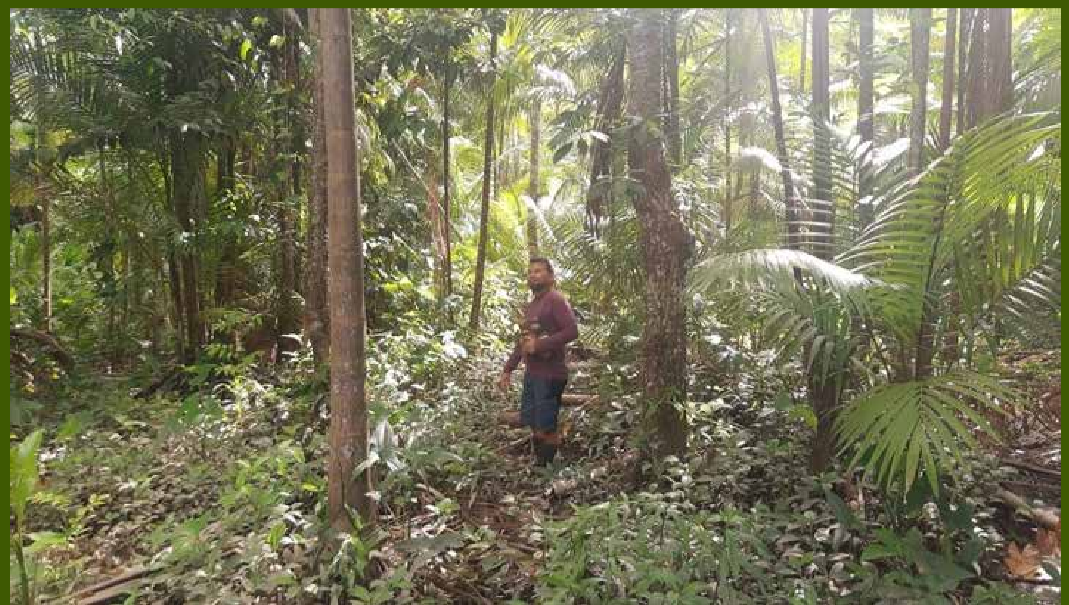
Presidente de ATAIC en zona de recolección de semillas.